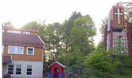
Vear kirke- liten og intim arbeidskirke