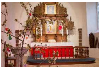
Sem kirke - høytidelig og tradisjonsrik middelalderkirke