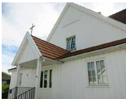
Barkåker menighetshus- koselig og uformell, med gangavstand lokalt på Barkåker