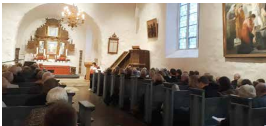
Bilde fra julegudstjenesten i Sem kirke.