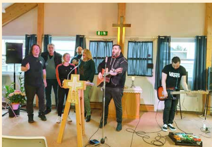
Venner fra Østerbo synger og vitner.

Vi ønsker Evangeliesenteret velkommen til byen og gleder oss over alle som gjennom deres innsats får hjelp til å komme ut av rusen.